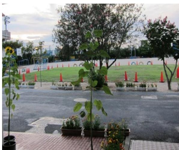
【玄関から見たグラウンド】