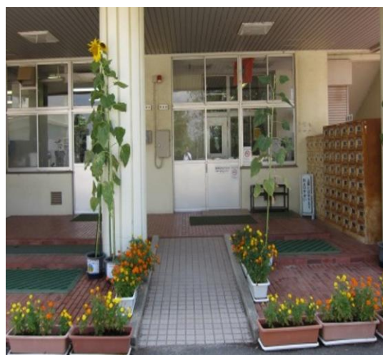
【玄関に置かれたひまわり】