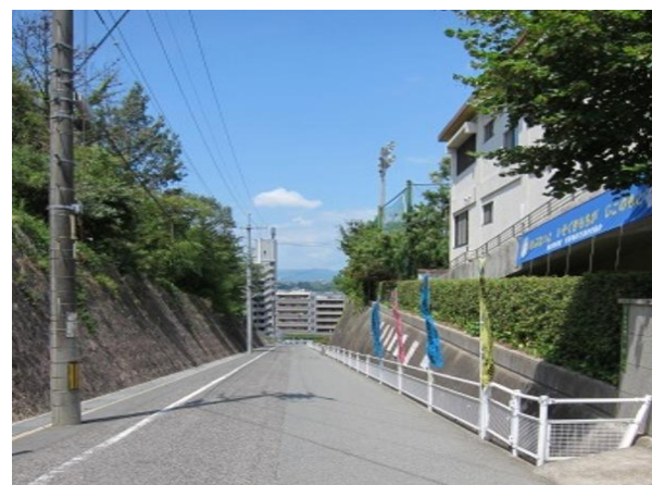
【正門前の学校坂道】